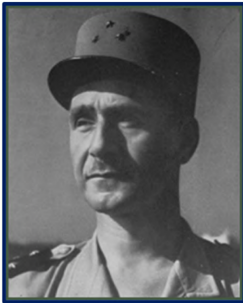
Général Joseph Magnan