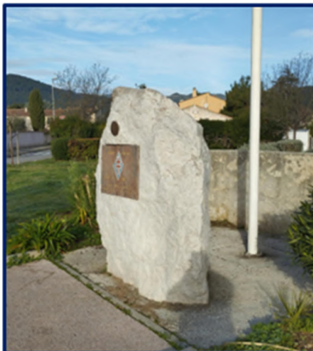
Stèle de la 1ère DFL

En juin 1998, afin de perpétuer le souvenir de cette brillante unité, la commune de Solliès-Pont a inauguré cette stèle et le square qui l'entoure.