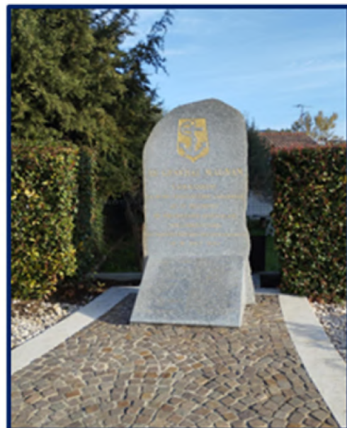
Stèle du général Magnan