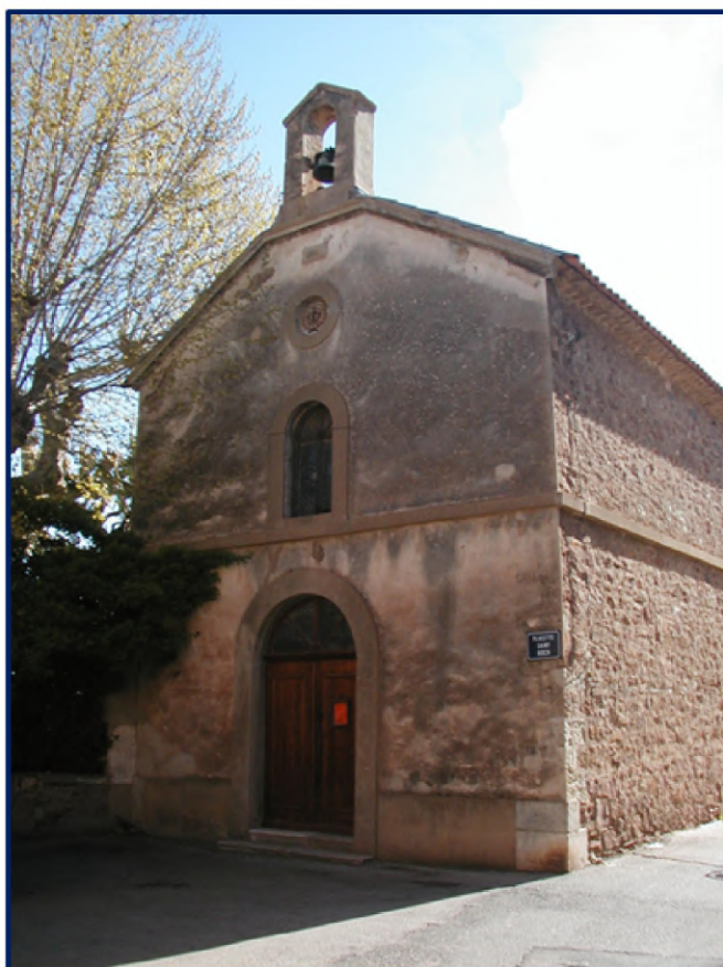
Chapelle Saint Roch - hameau des Laugiers

Les pertes sont nombreuses, mais un à un les quartiers sont délivrés et la commune de La Farlède est atteinte.