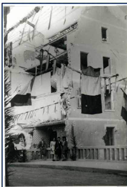
Traversée de Solliès-Pont après la destruction du pont (1944)