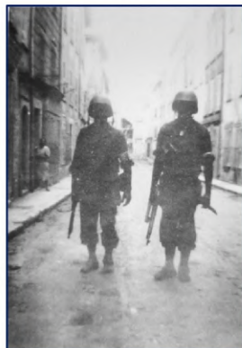
Tirailleurs sénégalais, Rue République - Solliès-Pont (1944)